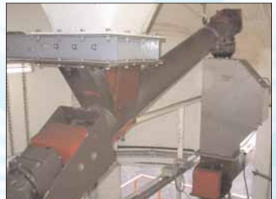
Regelung des Kalksteinmehl Austrages aus einem Silo

Messbereiche: Baby-FlowSlide 10 - 5000 l/h FlowSlide 0 - 10 / 25 / 50 / 60 / 80 / 100 / 200 m 3 /h