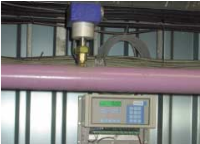
4 MIC-Sensor an einer DN-60-Förderleitung für Kalksteinmehl 4 MIC sensor on a conveying pipe DN 60 for limestone powder

Typische Anwendungsfälle in der Baustoffindustrie sind