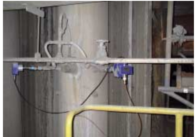
5 Zwei Sensoren messen die zum Brenner geförderte Kohlestaubmenge 5 Two sensors for the flow-measurement of the coal dust conveyed to the burner

Weitere Informationen: www.hense-waegetechnik.de