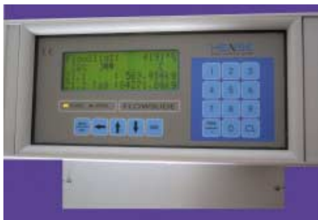
3 Auswerte-Elektronik des FlowSlide-Messsystems 3 Evaluation electronics of the FlowSlide system

The FlowSlide system offers a precise and maintenance free mass flow measurement for all free flowable solids within a density range or 0.02 to 3.5 kg/l. The dust tight housing is manufactured of high strength aluminium. All parts with direct product contact are made of stainless steel. For abrasive or aggressive products Titan or ceramic reinforced solutions are available. Due to the high measuring speed (500 readings/sec) FlowSlide is ideal for measuring pulsating flow caused by rotary valves or screw conveyors. The electronic provides an output contact to activate an automatic cleaning cycle via air nozzles. The FlowSlide system is available for flow ranges from